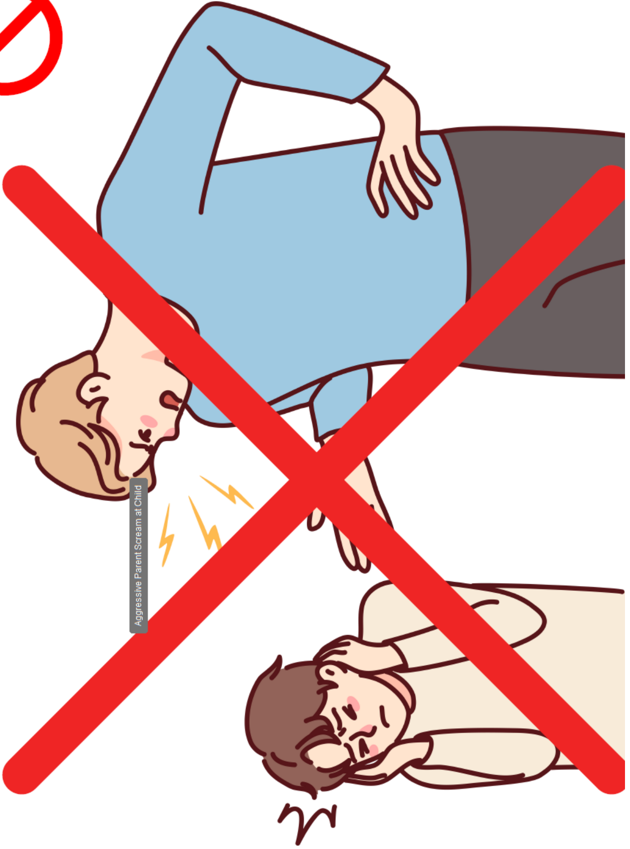
Aggressive Parent Scream at Child